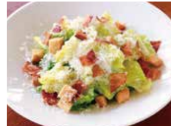
CAESAR SALAD シーザーサラダ