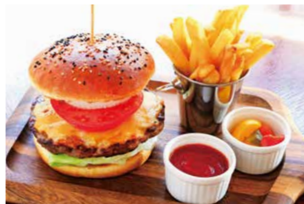
R. H. B. B. (ROSE HOTEL YOKOHAMA BEEF BURGER) R. H. B. B. (ローズホテル横浜ビーフバーガー)