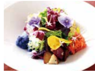
KANAGAWA VEGETABLES GARDEN SALAD 神奈川県契約農家のガーデンサラダ