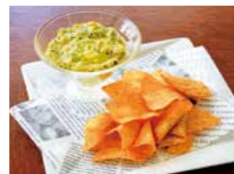
AVOCADO DIP & TORTILLA CHIPS アボカドディップ&トルティーヤチップス