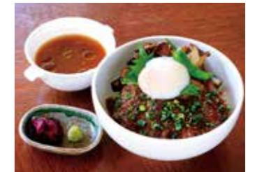
BEEF SIRLOIN STEAK OVER RICE (WITH SOUP) 牛サーロインステーキ丼 (スープ付)