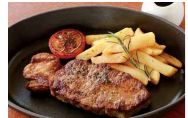
SIRLOIN STEAK (225G) 放牧牛のサーロインステーキ (225g)