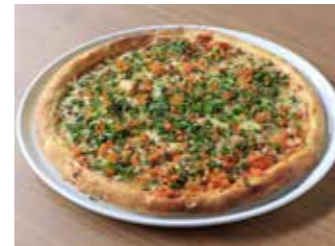
PIZZA WITH SAKURA SHRIMP AND SHIRASU AND MULLET ROE 桜エビとシラスとからすみのピザ