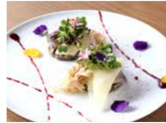
MARINATED JAPANESE SPANISH MACKAREL WITH CAULIFLOWER FUNGUS PICKLES AND ROSELLE SAUCE 鯖のマリネ花びら茸のグレッグ ハイビスカスロゼールのソース