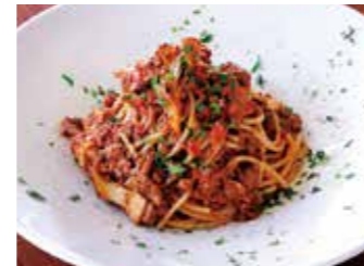
BOLOGNESE SPAGHETTI WITH MUSHROOM キノコ入りボロネーゼ スパゲッティ