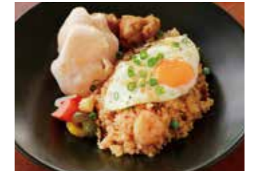
MILLY STYLE NASI GORENG ミリー特製 ナシゴレン