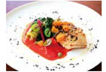
SAUTEED FISH OF THE DAY 本日鮮魚のソテー 本日の調理法で