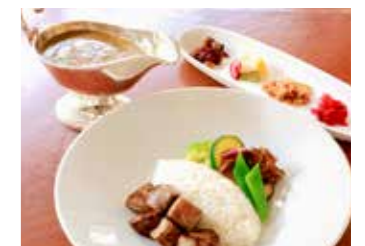
EUROPEAN BEEF CURRY WITH CUBED STEAK RICE サイコロステーキの欧風ビーフカレー