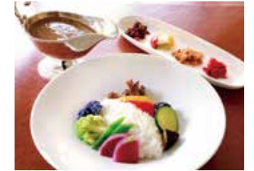
VEGETABLE COCONUT MILK CURRY ベジタブルココナッツミルクカレー