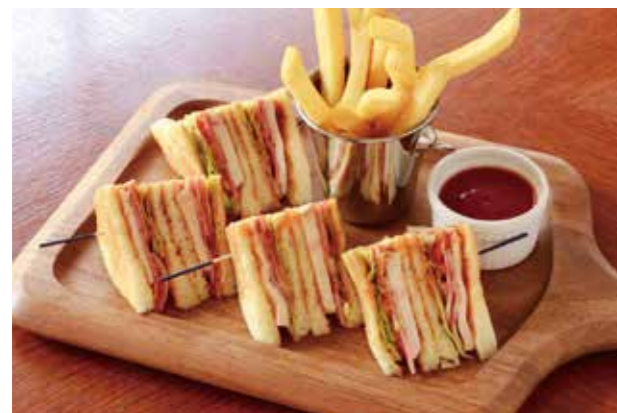
CLUB HOUSE SANDWICH クラブハウスサンドイッチ