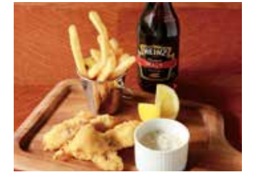
FISH & CHIPS WITH HOMEMADE TARTAR SAUCE フィッシュ&チップス 自家製タルタルソース