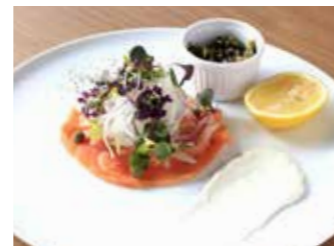
MARINATED SMOKED SALMON スモークサーモンのマリネ