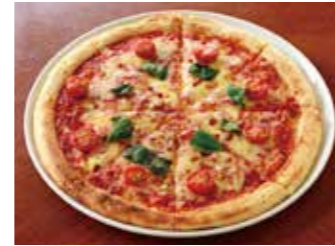
PIZZA MARGHERITA ピザ マルゲリータ