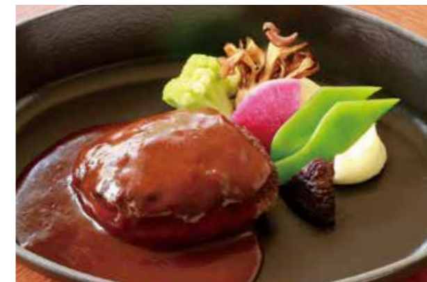
MILLY STYLE HAMBURG STEAK (200G) ミリー特製ハンバーグステーキ (200g)